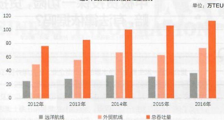
- 近5年武汉港集装箱吞吐量情况 -

首先,1140TEU型船要想有比较好的市场表现,必须将武汉港的集装箱运输市场做大,市场规模至少要在目前的基础上翻一番。为此,需要加快建立完善“铁水空水管”无缝衔接的港口综合运输枢纽,延伸武汉长江中游航运中心的腹地范围,改变现有运输格局,吸引长江中