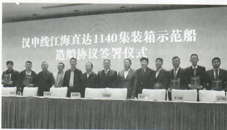
汉申线江海直达1140TEU集装箱示范船造船协议签署仪式

江海直达运输货物出海效率高、货损小、物流成本低，且时效性强、单位运量环境污染小，是一种便捷高效、绿色经济的运输方式。推进江海直达运输发展，是深化交通运输供给侧结构性改革的重要内容。为鼓励江海直达运输，仅2017年，交通运输部就先后发布了《关于推进特定航线江海直达运输发展的意见》《特定航线江海通航船舶建造规范》《特定航线江海直达船舶法定检验暂行规则》《关于加强特定航线江海直达船舶安全监管的通知》等一系列文件，江海直达运输所需的外部条件已逐步完善，示范船舶的建造，更为市场推进注入新动能。